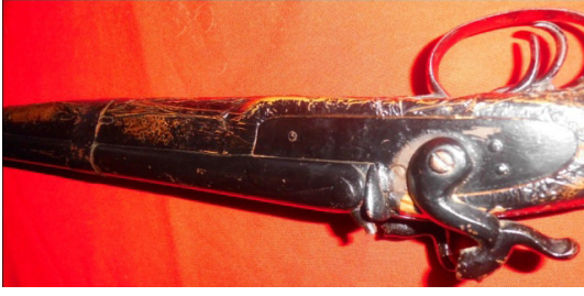
Fot.39,No-12,Tire Kent Müzesi,tüfek