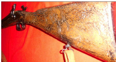
Fot.38,No-12,Tire Kent Müzesi,tüfek