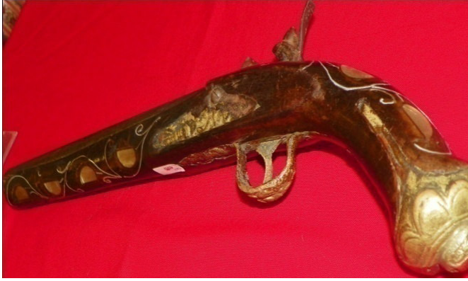
Fot.18,No-7,Tire Kent Müzesi,piştov