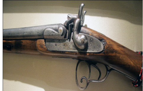
Fot.26, No-9, ÖYKAM tüfek