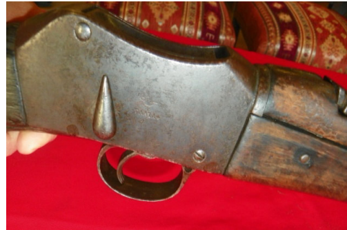
Fot.50,No-14,Tire Kent Müzesi,tüfek