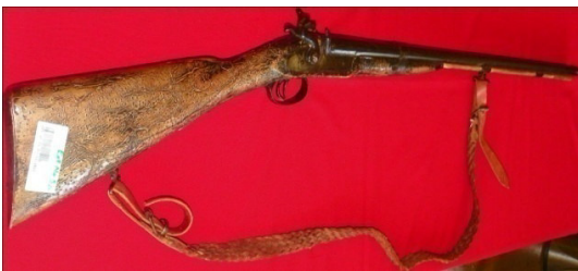
Fot.37,No-12,Tire Kent Müzesi,tüfek