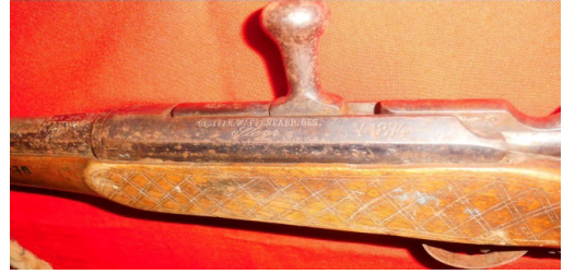
Fot.52,No-15,Tire Kent Müzesi,tüfek