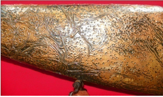
Fot.41,No-12,Tire Kent Müzesi,tüfek