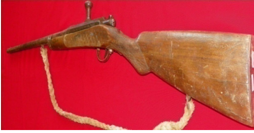
Fot.51,No-15,Tire Kent Müzesi,tüfek