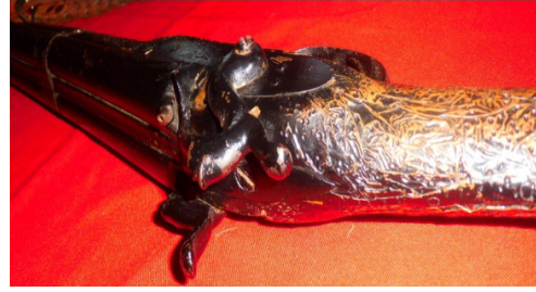
Fot.40,No-12,Tire Kent Müzesi,tüfek