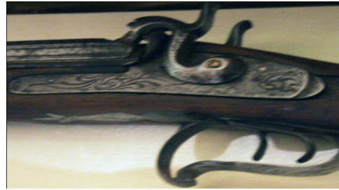
Fot.24, No-8, ÖYKAM tüfek