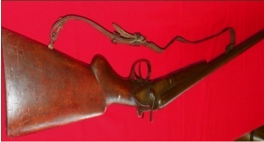
Fot.43,No-13,Tire Kent Müzesi,tüfek