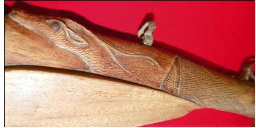
Fot.54,No-16,Tire Kent Müzesi,tüfek