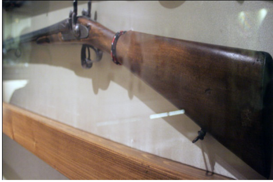
Fot.25, No-9, ÖYKAM tüfek