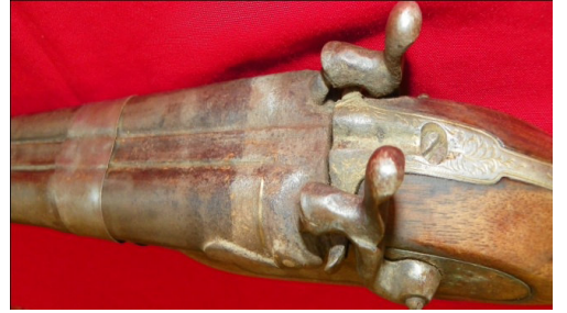
Fot.56,No-16,Tire Kent Müzesi,tüfek