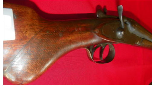
Fot.46,No-13,Tire Kent Müzesi,tüfek