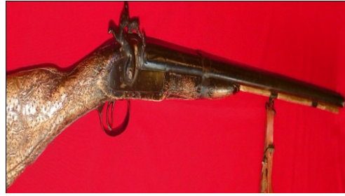
Fot.36,No-12,Tire Kent Müzesi,tüfek