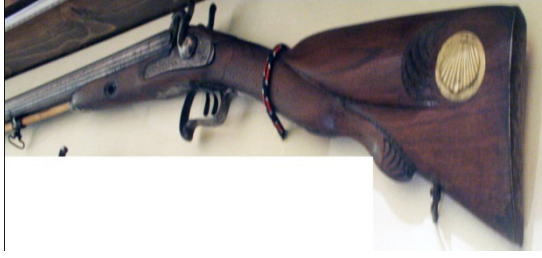
Fot.21, No-8, ÖYKAM tüfek