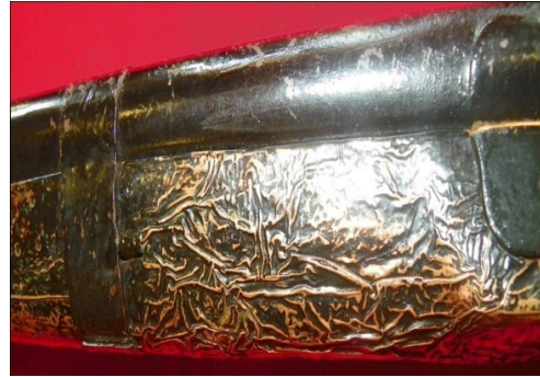
Fot.42,No-12,Tire Kent Müzesi,tüfek