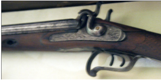
Fot.23, No-8, ÖYKAM tüfek