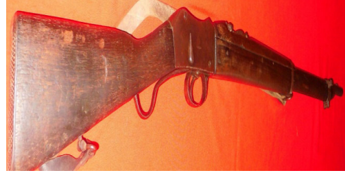
Fot.48,No-14,Tire Kent Müzesi,tüfek