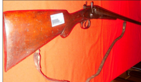
Fot.44,No-13,Tire Kent Müzesi,tüfek