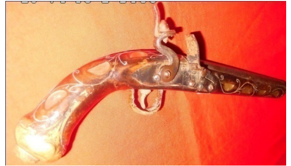
Fot.17,No-7,Tire Kent Müzesi,piştov