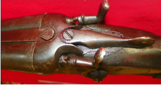
Fot.47,No-13,Tire Kent Müzesi,tüfek