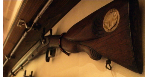
Fot.22, No-8, ÖYKAM tüfek