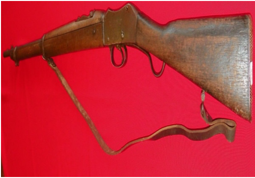
Fot.49,No-14,Tire Kent Müzesi,tüfek