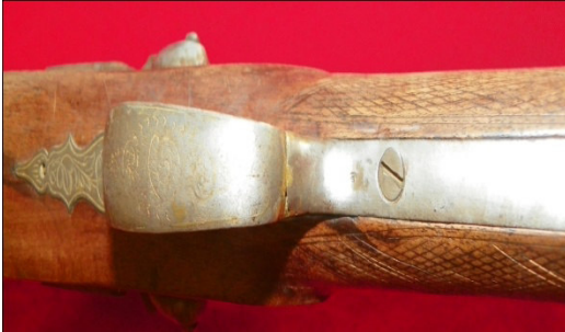
Fot.55,No-16,Tire Kent Müzesi,tüfek