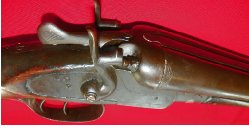
Fot.45,No-13,Tire Kent Müzesi,tüfek