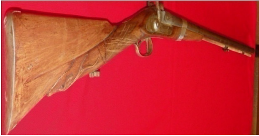
Fot.53,No-16,Tire Kent Müzesi,tüfek