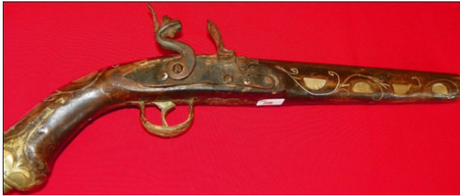
Fot.16,No-7,Tire Kent Müzesi,piştov