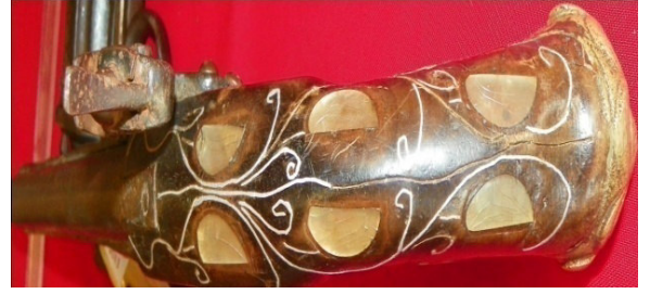
Fot.19,No-7,Tire Kent Müzesi,piştov